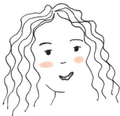
* is Emma